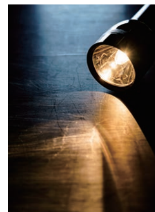
災害時の ライフラインの確保