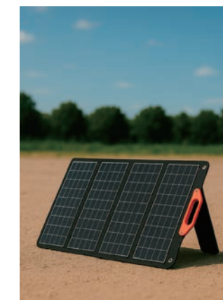
太陽光充電による 長期稼働