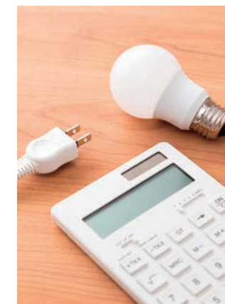
夜間充電、昼間節電