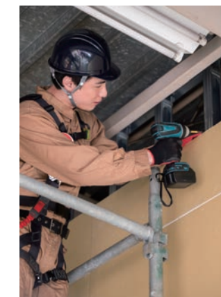
現場作業の電源確保