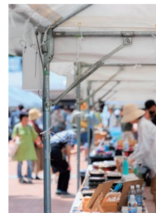
イベント・アウトドア 電源